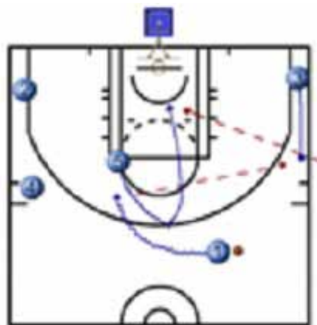
Tendencia Resto Equipos