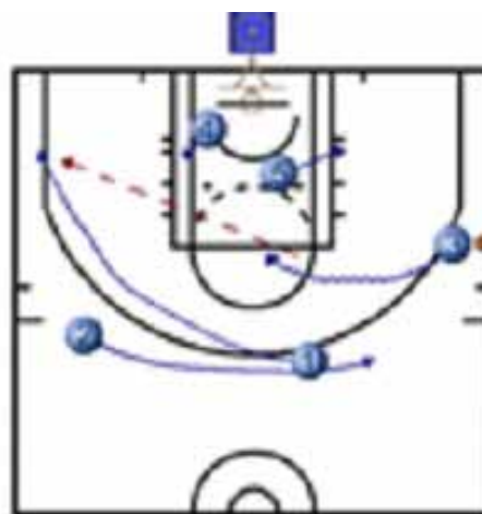
Juego por parejas si Lucic penetra (Trabajo muy interesante/Conceptos)