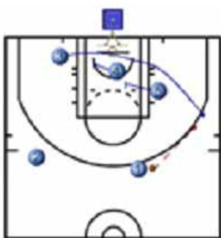
Tiro para Lucic

- Sistema 2: Bloqueos indirectos para salida del tirador (especialmente para Lucic y Bogdanovic)