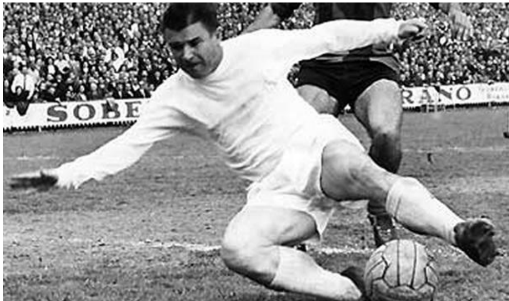
Ferenc Puskas, Cañoncito Pum (2-IV-1927 / 17-XI-2006)