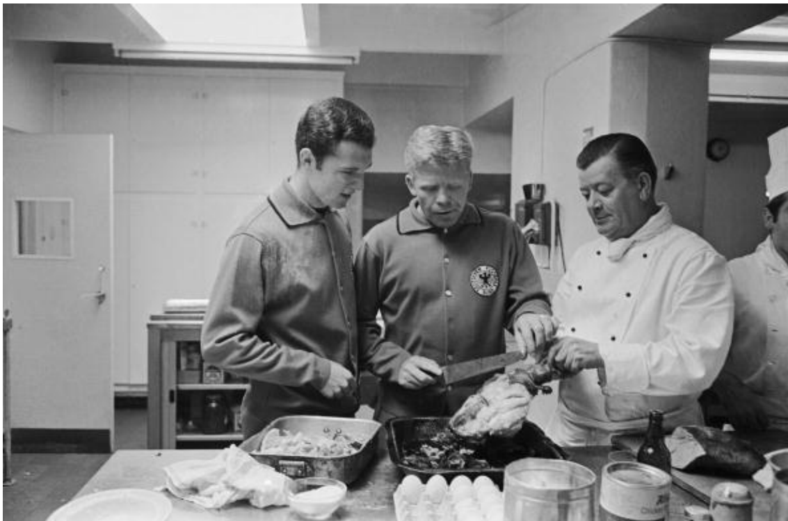
Franz Beckenbauer y Helmut Haller, en la cocina del hotel, durante el Mundial de fútbol 1966