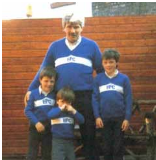
Jamie Carragher y su familia

chos partidos, empiezan a reconocer al eterno rival.